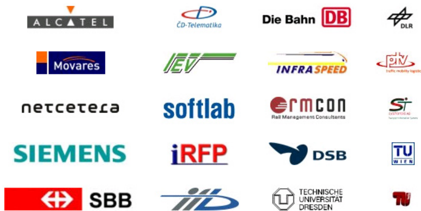
Bild: Ausgewählte railML.org-Partner

Jedes der hier aufgeführten Schemen kann beliebig innerhalb einer Datei mit einem anderen dieser Art kombiniert werden, so dass also nicht für jedes Modell eine gesonderte Datei erstellt werden muss. Die innere Struktur der railML®-Schemen ist von der Bedienung her identisch. Gemäß railML®-Philosophie werden möglichst wenige Angaben als notwendig definiert, um dem Anwender freizustellen, wie viele der zur Verfügung stehenden Eigenschaften er mit seinen Daten belegen will. Damit entstehen sehr flexible Datenstrukturen, die einerseits auf die Bedürfnisse des einzelnen Nutzers zugeschnitten, andererseits aber weitestgehend universell einsetzbar sind, ohne unübersichtlich zu werden.